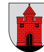
Panevėžys City Municipality