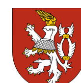
City of Usti nad Labem